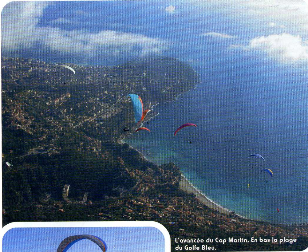
L'avancée du Cap Martin. En bas la plage du Golfe Bleu.

PERLE DU VOL LIBRE MÉDITERRANÉEN, SITE DE FRÉQUENTATION MONDIALE, OUVERT 7 MOIS DE L'ANNÉE, ROQUEBRUNE OFFRE UNE AÉROLOGIE GÉNÉREUSE DANS UN SUPERBE DÉCOR.